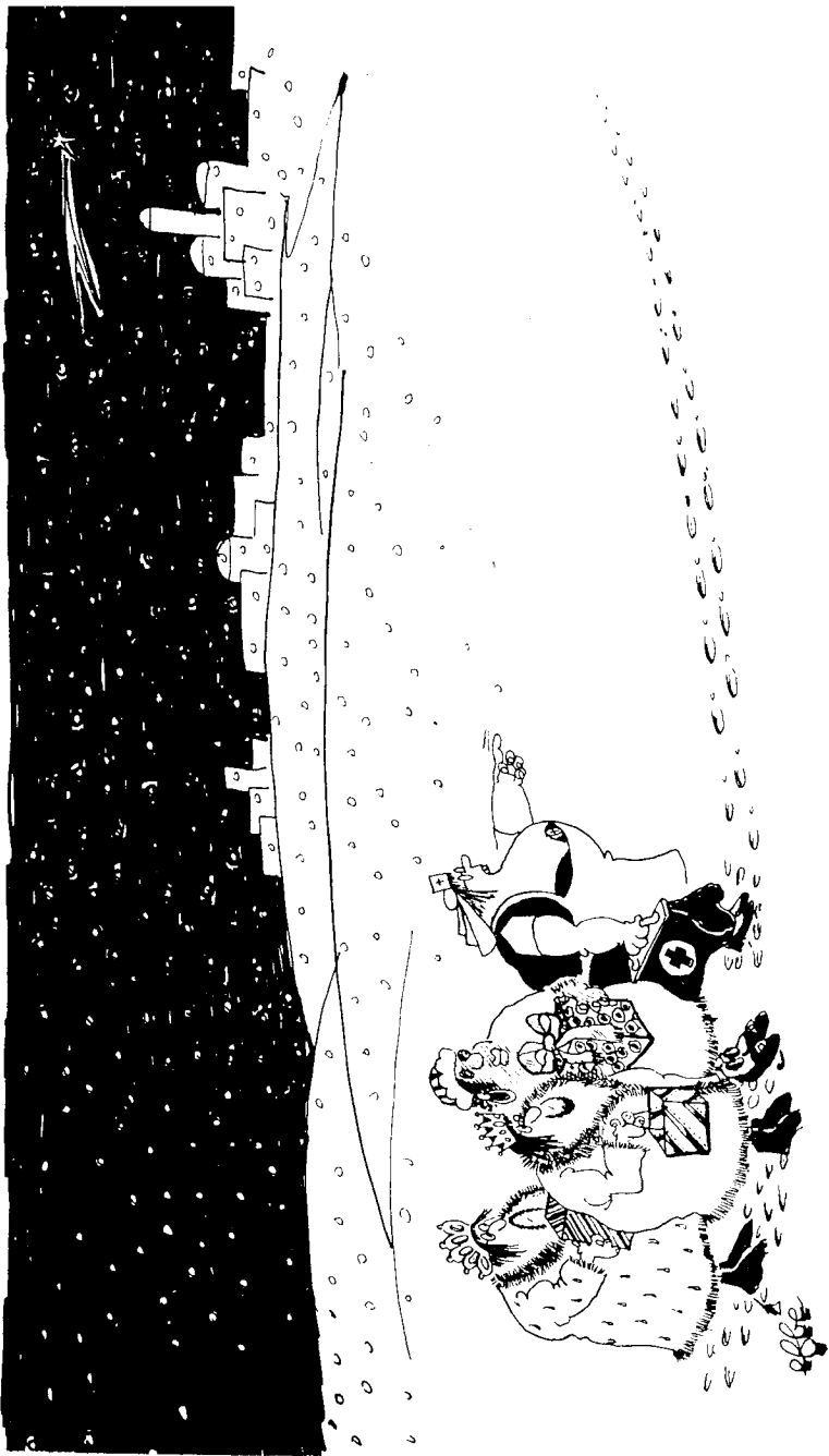
Elke g' jkenis met medewerkers van SIZ berust ni op toeval.