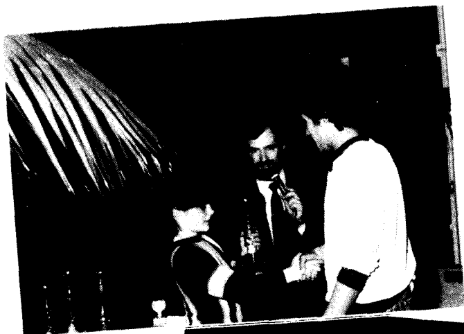
De derde prijs- winnaar Zwette- Hage