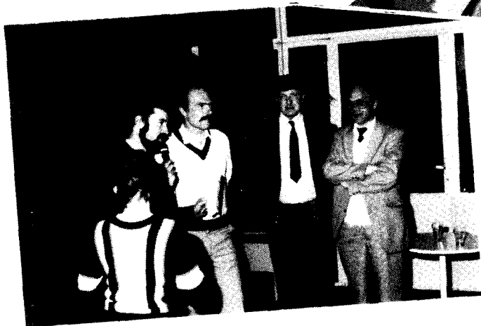
De scheidsrechters worden bedankt