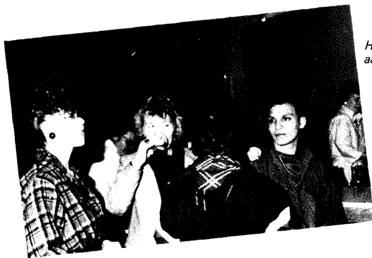
Het was geweldig aan de bar